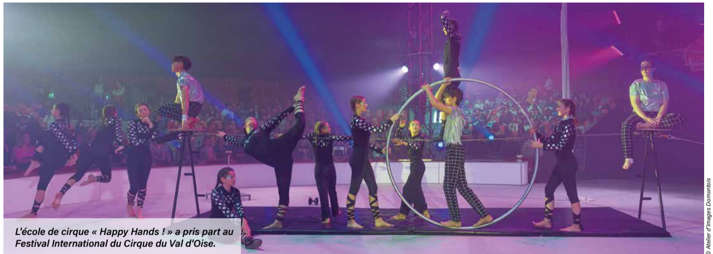
L'école de cirque « Happy Hands ! » a pris part au Festival International du Cirque du Val d'Oise.

Les cours sont ouverts dès 3 ans et se répartissent en fonction de l'âge et du niveau